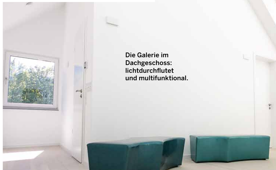
Die Galerie im Dachgeschoss: lichtdurchflutet und multifunktional.

Wohngesundheit erfordert exzellente Luftqualität und gute Raumluft fängt schon bei der Auswahl der Werkstoffe an. Alle für den Innenausbau relevanten Materialien des von