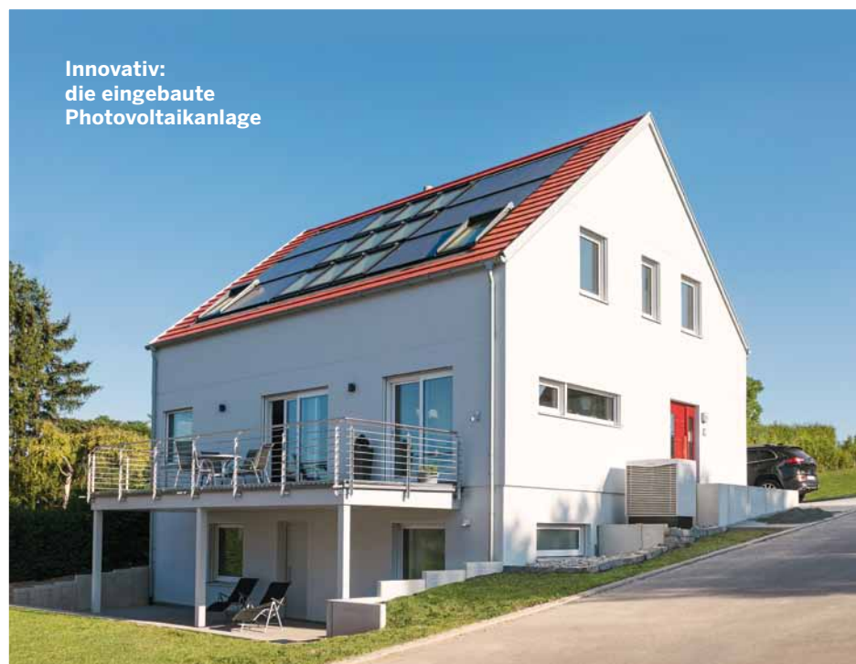
Innovativ: die eingebaute Photovoltaikanlage